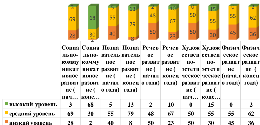
Сводная таблица освоения ОП ДО в 2022-2023 учебном году

Наилучшие показатели по образовательным областям «Социально-коммуникативное развитие» (98 % освоения), «Познавательное развитие» (92%). Самые низкие показатели по образовательной области «Речевое развитие» (50%), «Художественно-эстетическое развитие» (70%), «Физическое развитие» (64%)